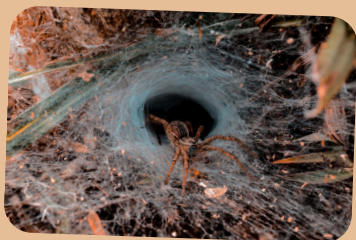
De Trechterspin maakt een tunnelweb

Spinnenwebben heb je in alle vormen en maten. Lukt het jou om een web te spinnen? Probeer het met een rolletje touw en plakband.