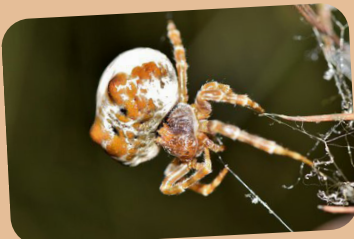
De bolaspin maakt een lasso om zijn prooi te vangen