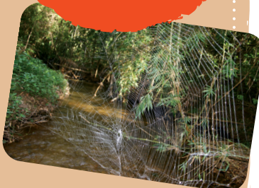
Een groot vangnet van Darwins wielwebspin

Het grootste spinnenweb ooit gevonden was wel 2,8m 2 groot. Dat is even groot als een tweepersoonsbed!